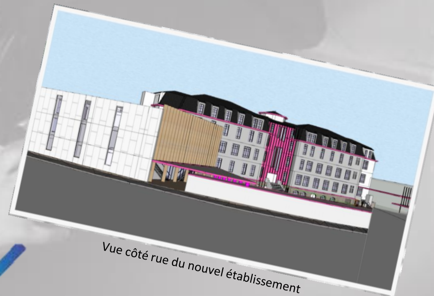
Vue côté rue du nouvel établissement